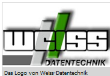
Das Logo von Weiss-Datentechnik

Der Firma Weiss Datentechnik wird nun durch ihren neuen Status als Tobit Technology Partner (TTP) eine engere und intensivere Zusammenarbeit mit Tobit Software ermöglicht, um auch eigene Lösungen im Zusammenspiel mit David(R)zehn! voranzutreiben. Neben Dienstleistungen wie Beratung bei Hard- und Softwarefragen und der Installation von maßgeschneiderten IT-Systemen, bietet Weiss Datentechnik die Software "Vannessa 3" an, eine individuell konfigurierbare Telefonzentrale für David ab der Version 6.6.